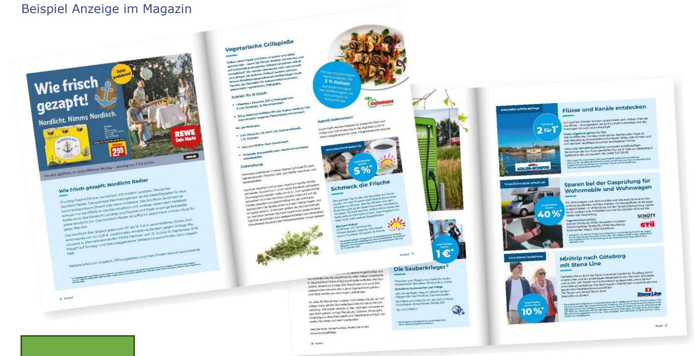
Beispiel Anzeige im Magazin

CMYK-Modus, Auflösung 300 DPI, +3mm Beschnittzugabe rundherum, formatfüllend und randabfallend